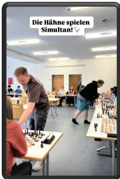
Die Hähne spielen Simultan!